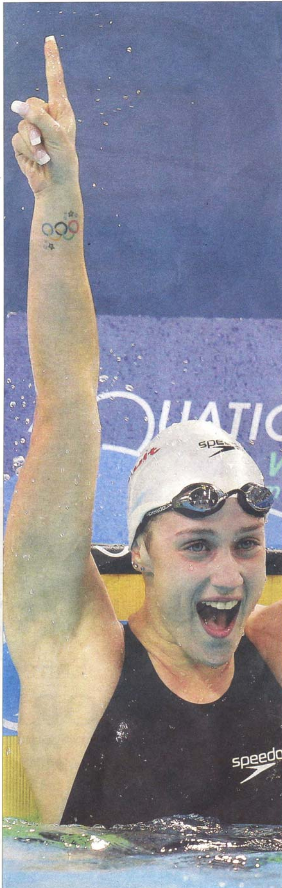
Mireia Belmonte, ayer, levanta el dedo índice tras ganar su tercer oro.

Ambos acabaron en el mismo tiempo, ni una centésima más ni una milésima menos, y cada uno recibió una plata. Detrás, el fran-